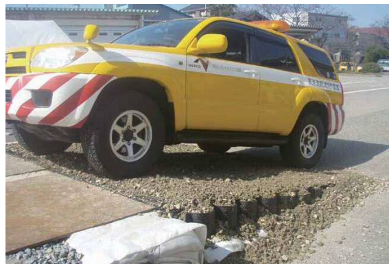
車両通過後も走行に支障となるわだちは発生しません