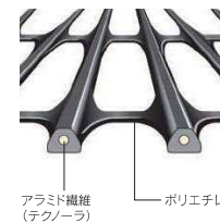
アラミド繊維(テクノーラ) ポリエチレン 網状シート(アラミド繊維+ポリエチレン)