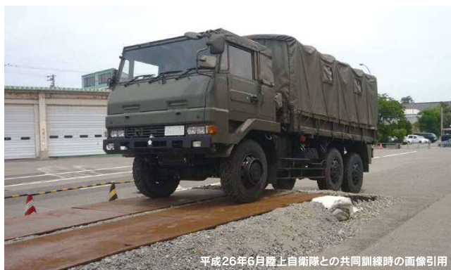
平成26年6月陸上自衛隊との共同訓練時の画像引用