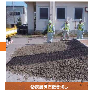
⑤表層碎石敷き均し