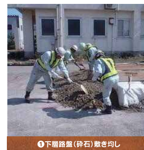
①下層路盤(碎石)敷き均し