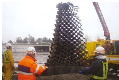
ハニカム構造体は容易に撤去可能で、残った碎石は、その後の簡易舗装における路盤材として使えます。

カタログ内の自衛隊車両の写真については、平成26年6月陸上自衛隊との共同訓練時NEXCO中日本により撮影された写真であり、防衛省自衛隊と「ジオスロープ」®工法それ自体には、一切関係ありません。