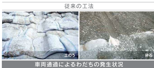
車両通過によるわだちの発生状況