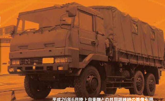
平成26年6月陸上自衛隊との共同訓練時の画像引用