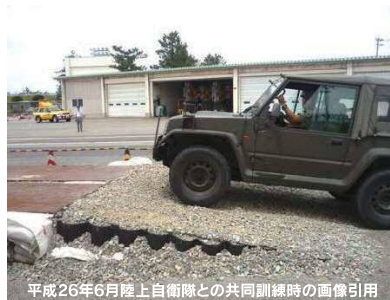
平成26年6月陸上自衛隊との共同訓練時の画像引用