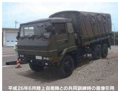
平成26年6月陸上自衛隊との共同訓練時の画像引用