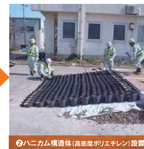
②ハニカム構造体(高密度ポリエチレン)設置