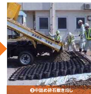
③中詰め碎石敷き均し