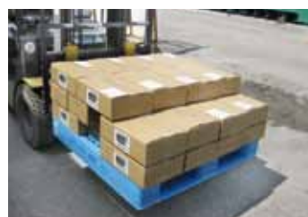
長期保存可能(6ヶ月程度)